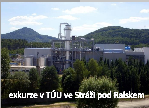
exkurze v TÚU ve Stráži pod Ralskem