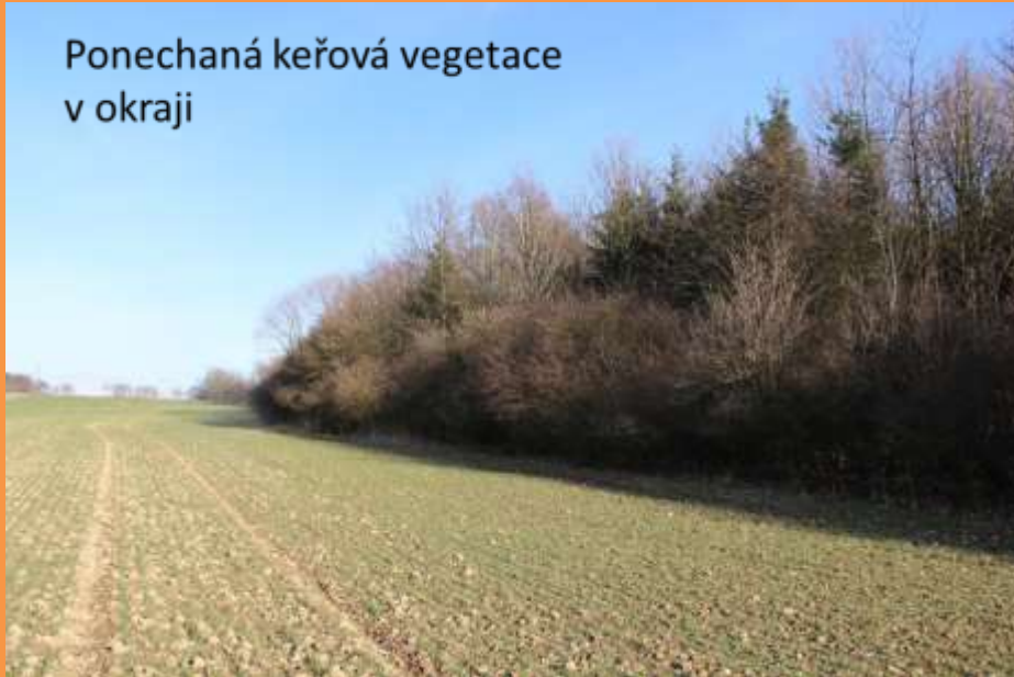
Ponechaná keřová vegetace v okraji