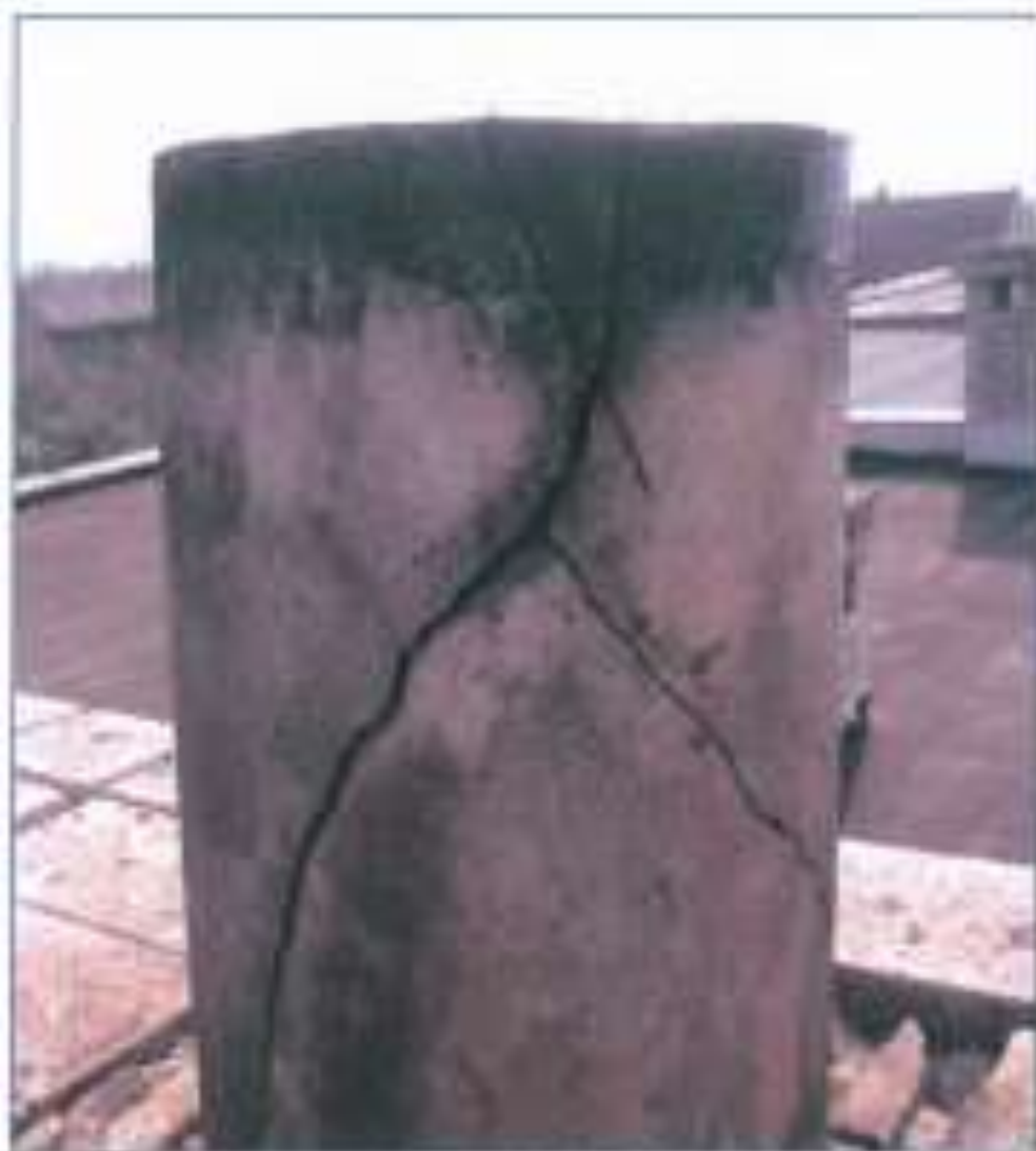
Popraskané zdivo i nástavec bývá důsledek vyhoření sazí