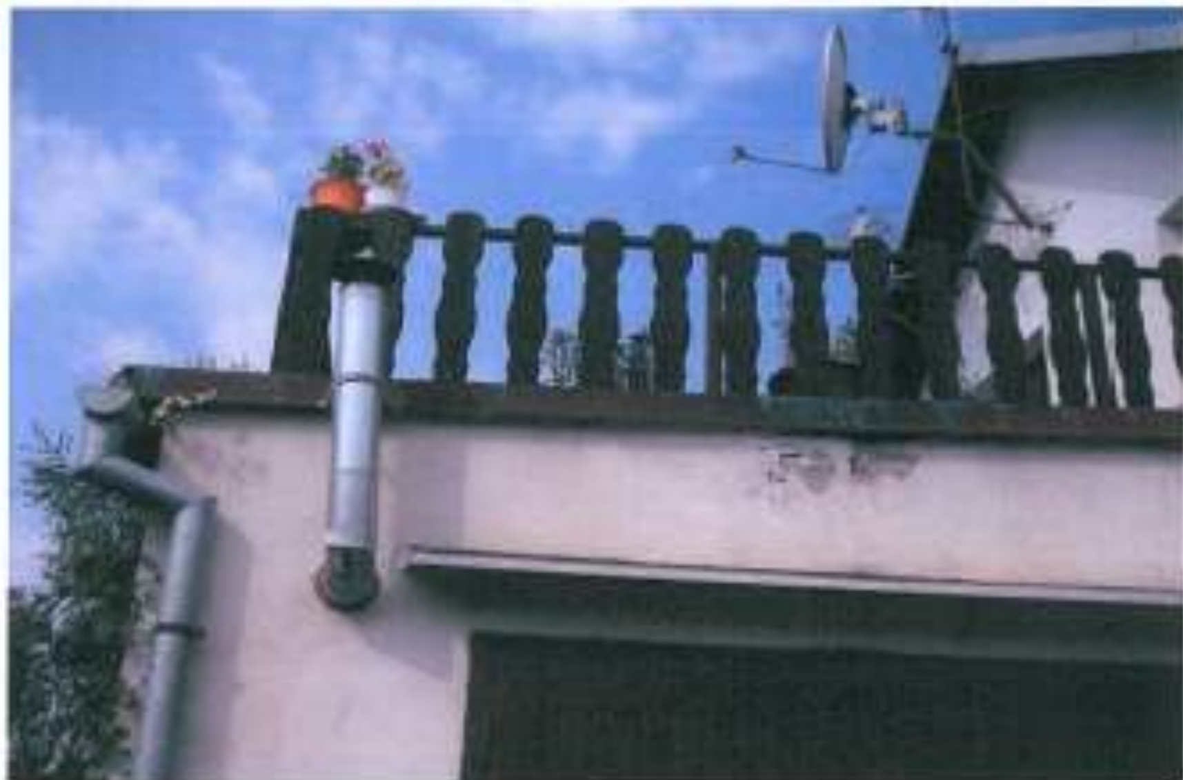
Nedodržení dostatečné výšky nad střechou objektu