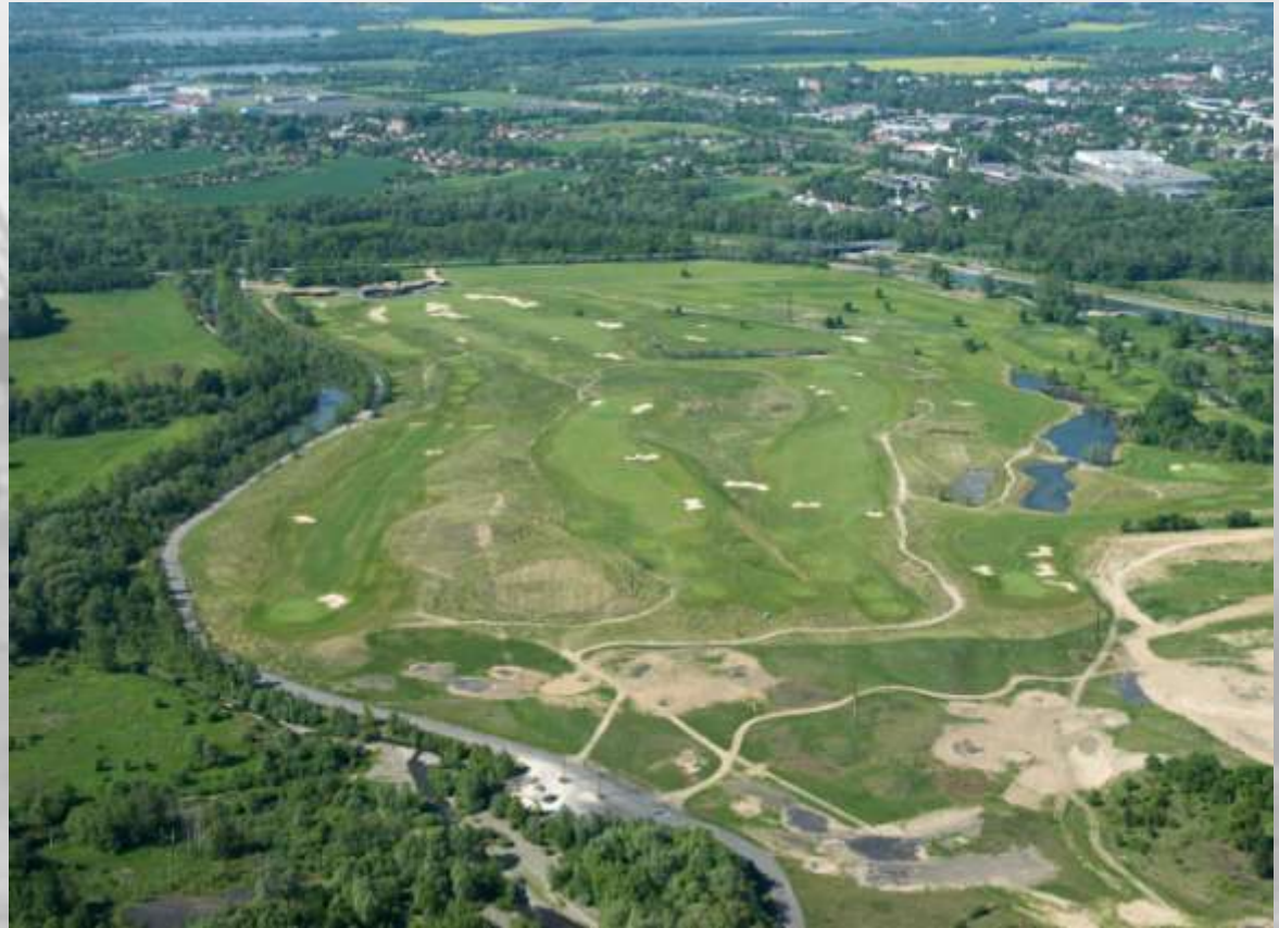
skutečný stav – jaro 2012