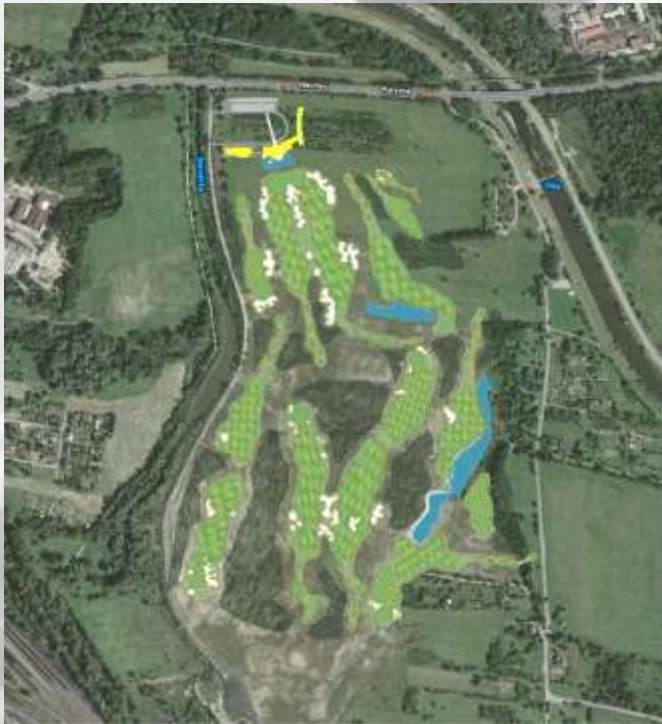
projekt - vizualizace r.2007