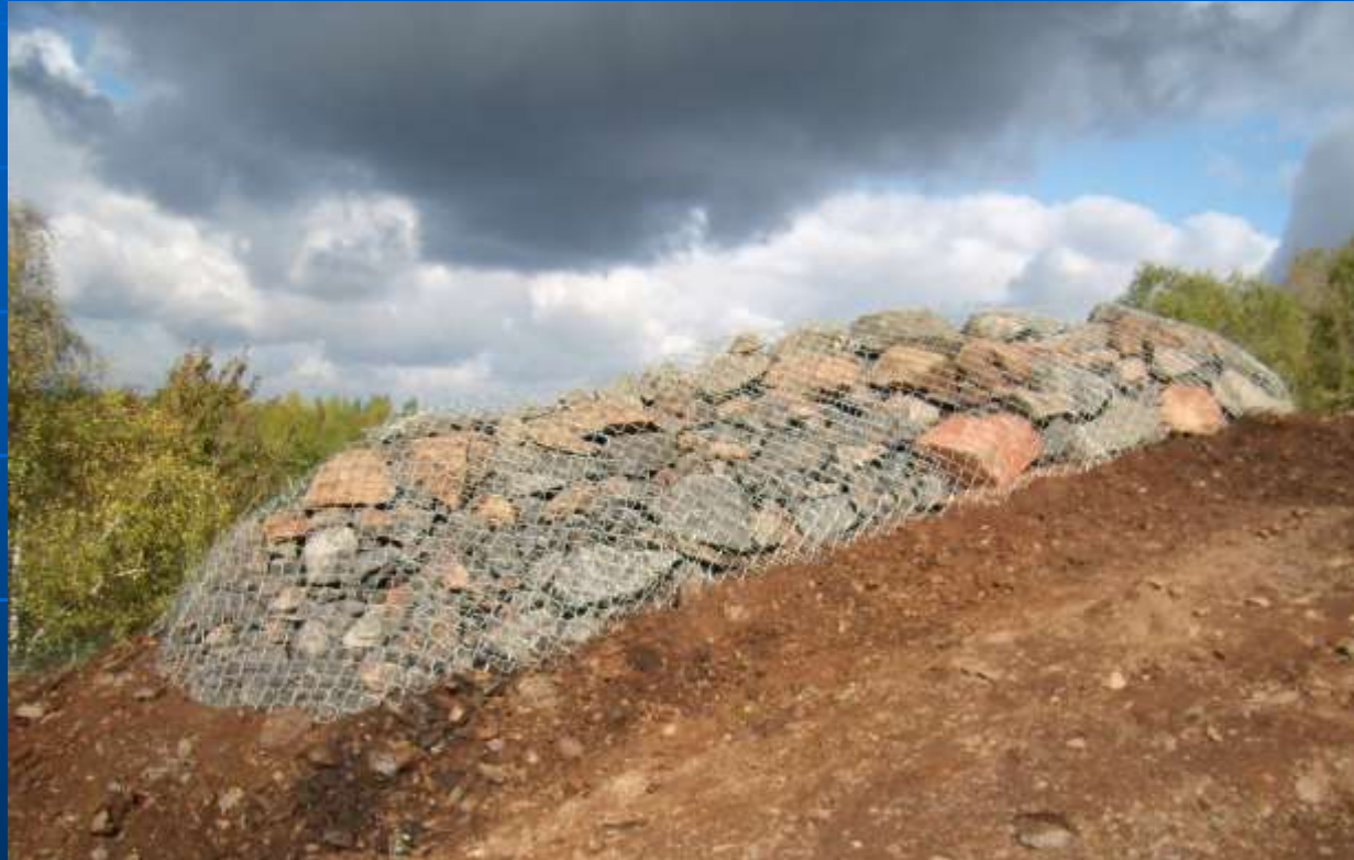
Rozptylový horninový kryt