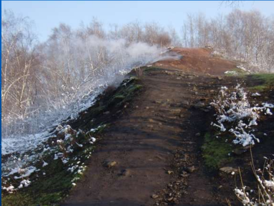
Důlní odval EMA – centrální přístupová cesta