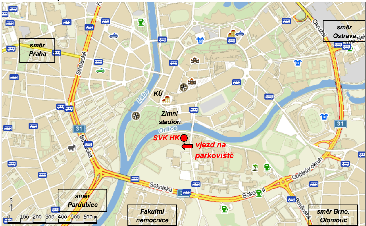
Orientační mapa - Hradec Králové