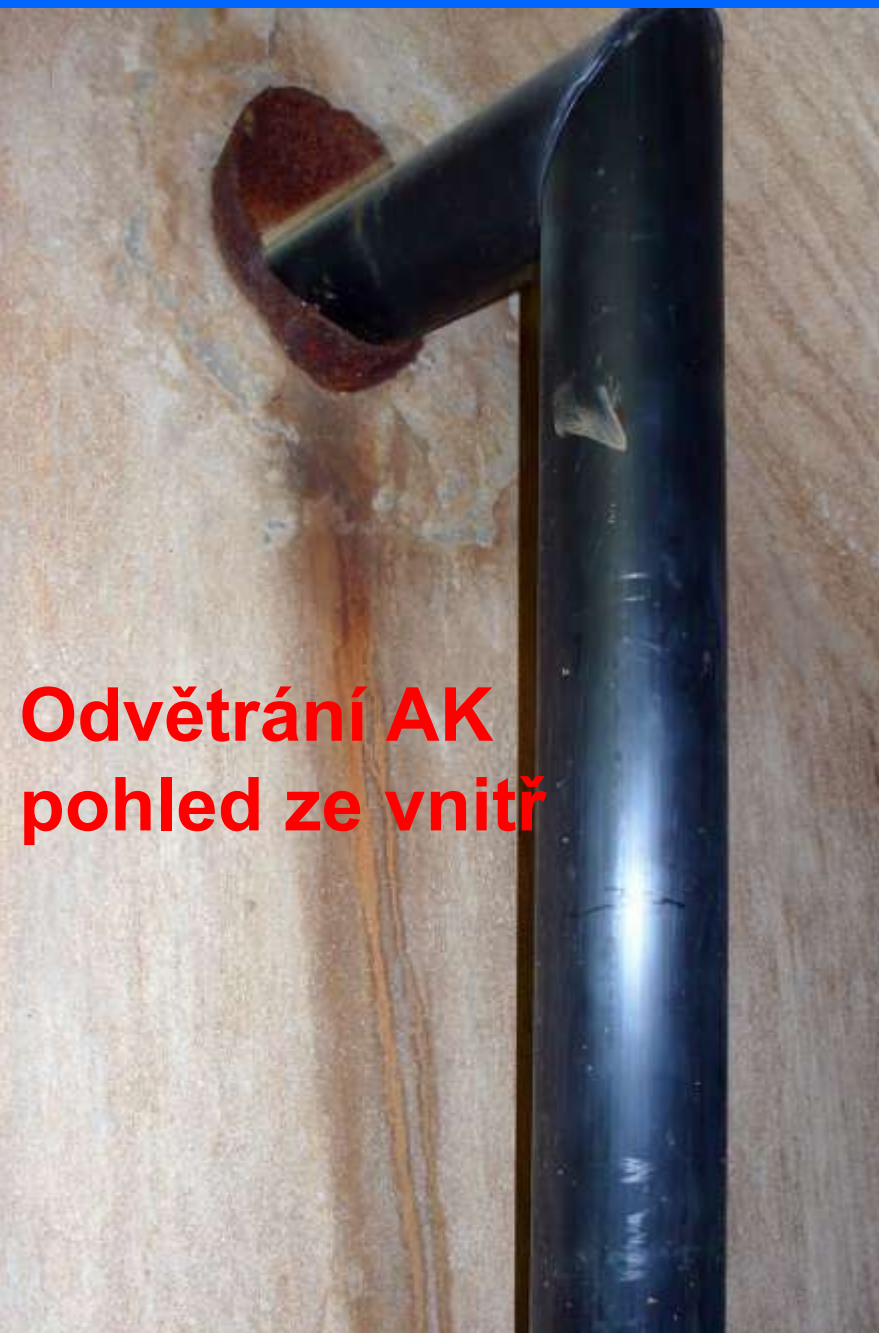
Odvětrání AK pohled ze vnitř