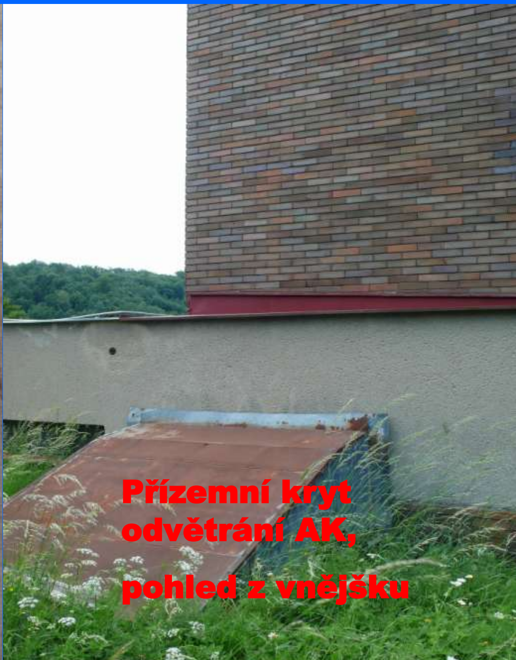
Přízemní kryt odvětrání AK, pohled z vnějšku