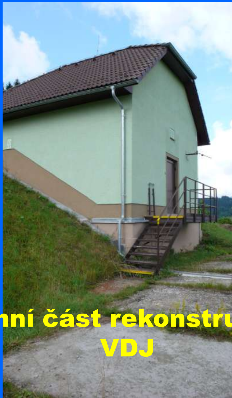
Nadzemní část rekonstruovaného VDJ